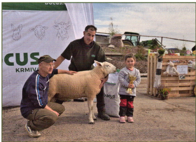
Šampión trhu se svou malou chovatelkou