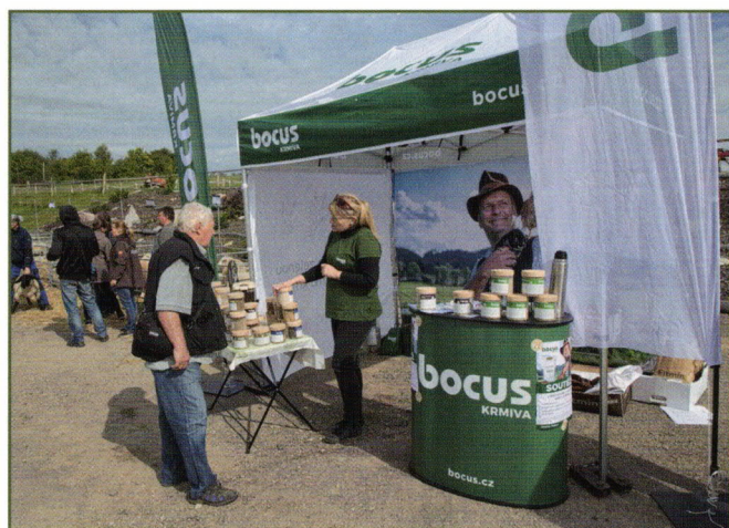
Stánek firmy Bocus