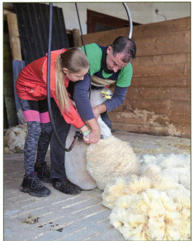
Příležitost ostříhat si ovečku