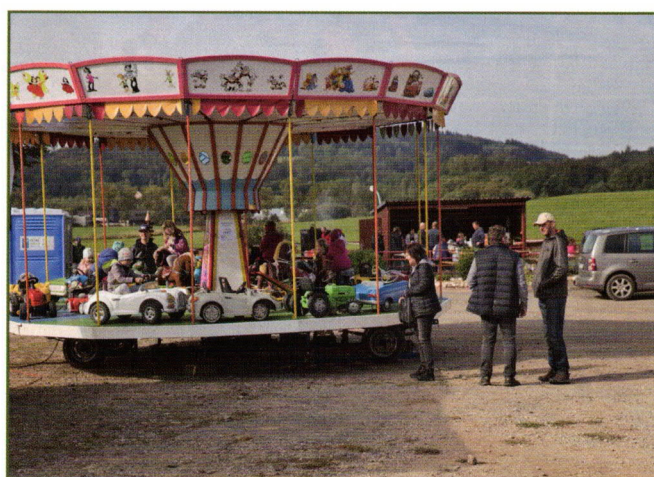
Zábava pro děti

Sluší se poděkovat Lukášovi, Dibaqu i všem dalším, kteří se nějak zasloužili o tento trh, který, jak doufám, založí novou tradici. Pokud to jen trochu půjde, pojedou tam napřesrok zase a něco s sebou přivezu, protože trh v Helvíkovicích přece