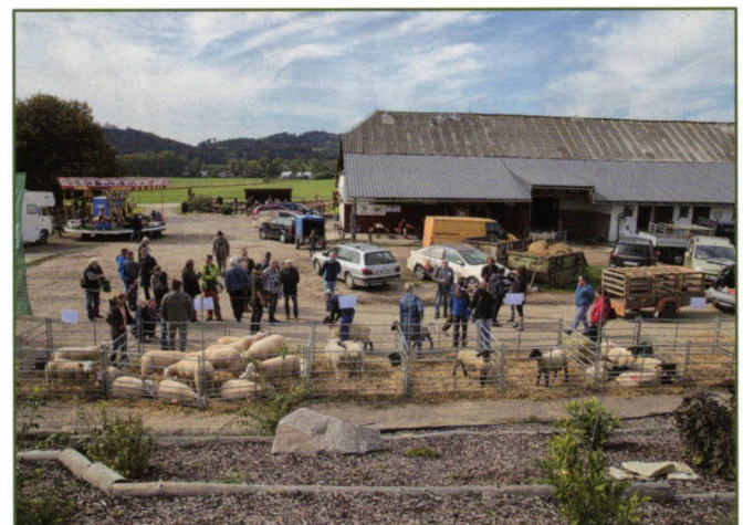
Pohled na areál chovatelského centra Fitmín