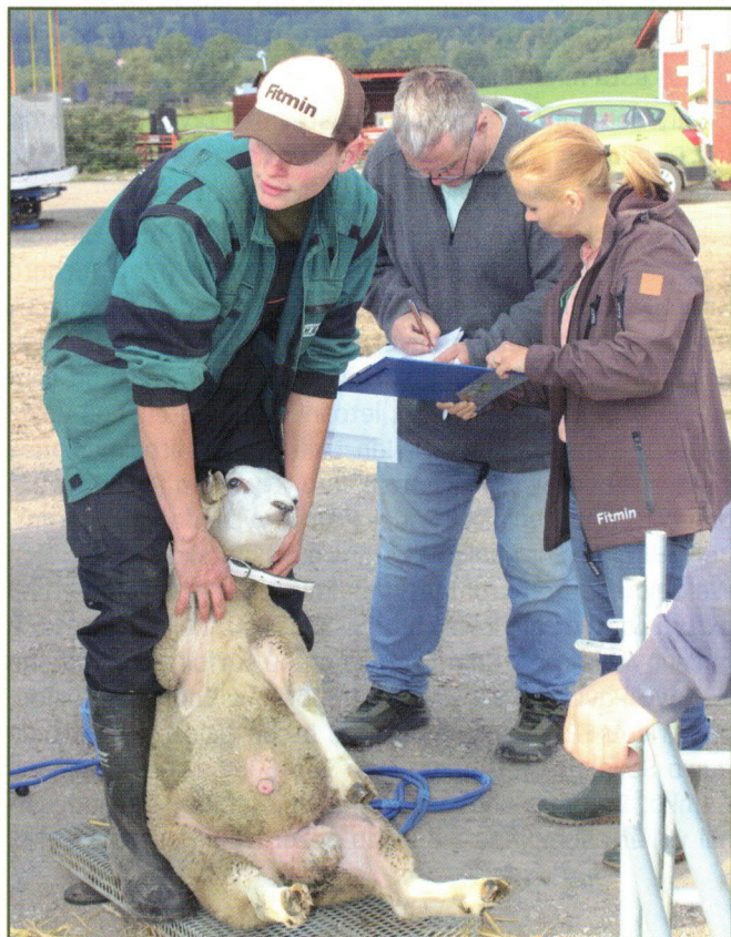
Vážení berana z chovu Dibaq a.s.