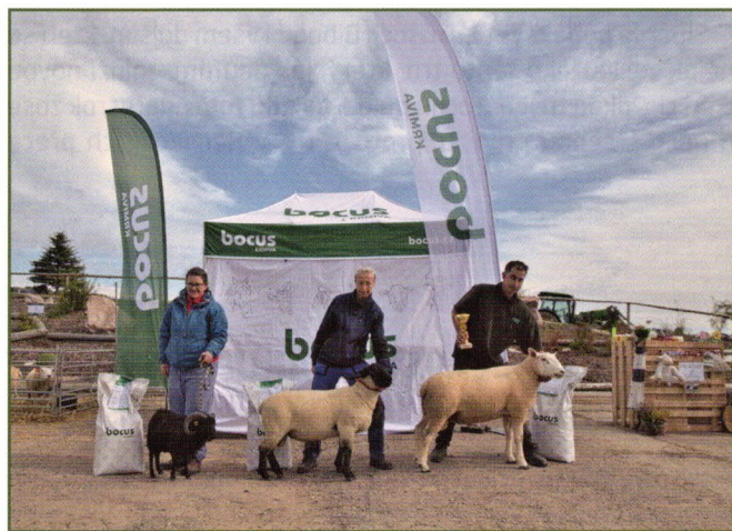
Tři nejlepší berani trhu