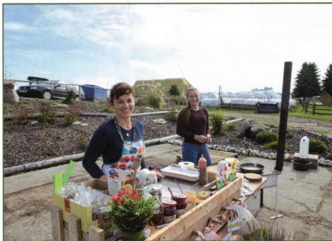
Paláčky od Vojtěšky